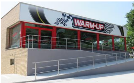
Brasserie - Tea-room – Restaurant Chaussée de Philippeville, 54A Loverval

Editeur responsable : Michel MONSEUR, Allée N-D de Grâce, 50 – Loverval Tél : 071/43.76.56 ruesnom@gmail.com